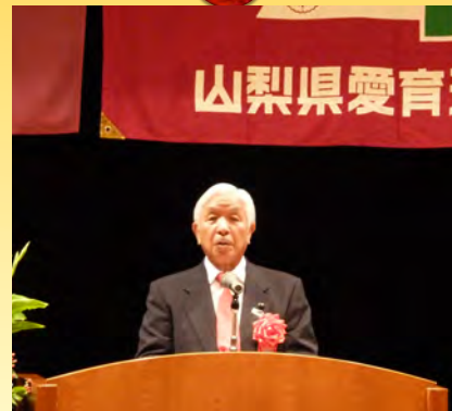
▲山梨県愛育大会でお祝いのあいさつ