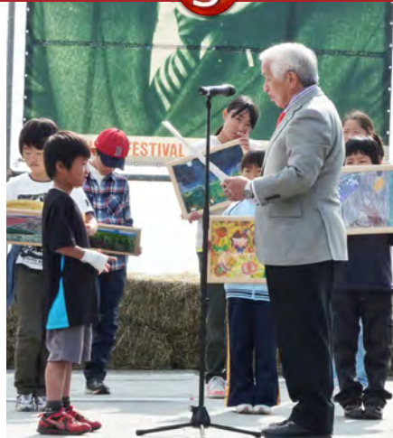
▲八ヶ岳カンティフェアにて国際児童絵画展の表彰をおこないました。