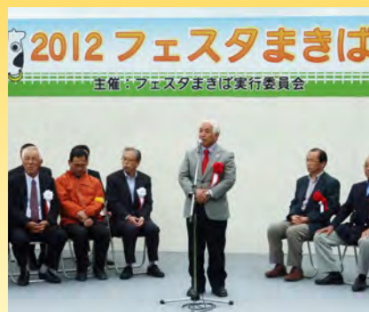
▲北杜市で行われた「フェスタまきば」でのあいさつ