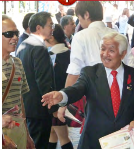
▲甲府駅前でも赤い羽共同募金の街頭活動を行いたくさんの方に募金していただきました。