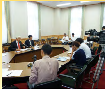
▲マスコミ各社の記者の質問に答える議長定例記者会見