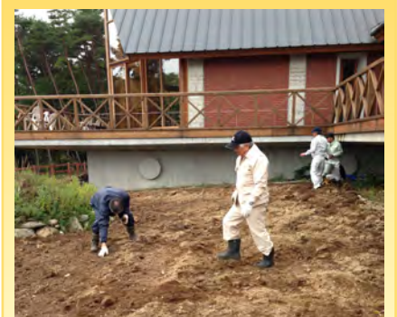
▲10月25日に行われた「菜の花プロジェクト」の会場整備