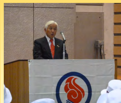
▲ぎふ清流国体結団式で本県選手たちを激励