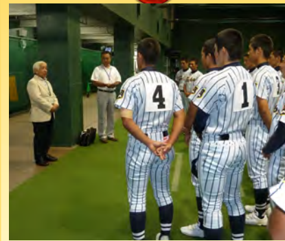
▲ベスト4に勝ち上がった東海大甲府高校野球部の選手たちを甲子園球場で激励