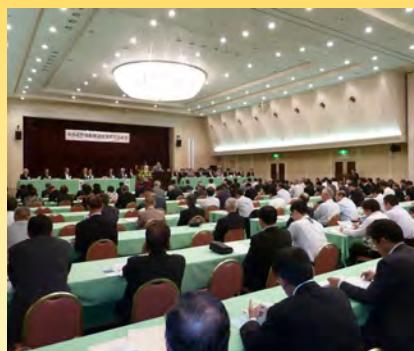
▲中部横断自動車道経済懇談会総会