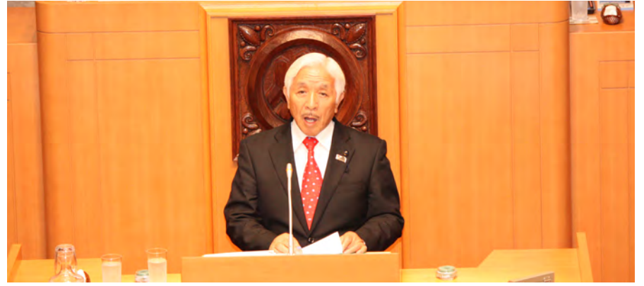
9月定例県議会で開会のあいさつ