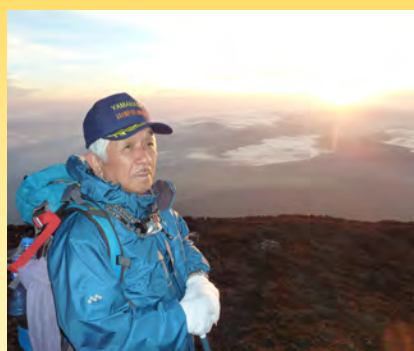
▲世界文化遺産登録を目指す富士山頂の御来光