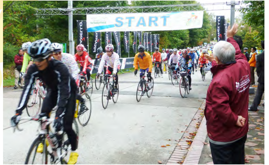
2,200人以上の選手が参加して、盛大にグランfond八ヶ岳を開催！

ところで、私の議長としての在任期間が、早いもので1年6ヶ月を経過しました。この間、私は、経済対策や防災、医療、福祉など県民生活に直結する県政の重要課題について、県議会で県民の意思を反映させた活発な議論が展開されるよう、さまざまな取り組みを進めてまいりました。