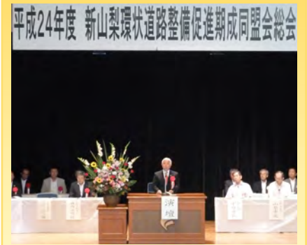
▲新山梨環状道路整備促進期成同盟会であいさつ