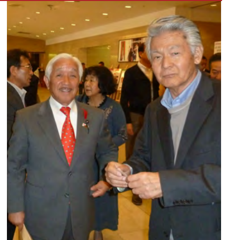
▲有機・自然共生農業を考えるつどい 菅原文太さんと歓談