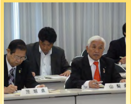
▲全国都道府県議会議長会の国土交通委員会及び経済産業委員会へ出席