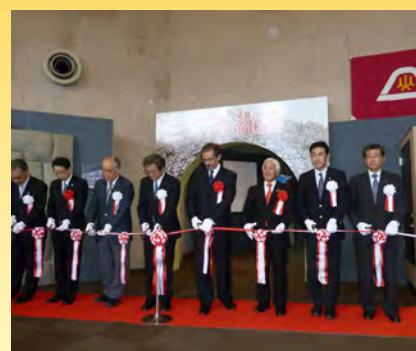
▲考古博物館のインカ帝国展でのテープカット