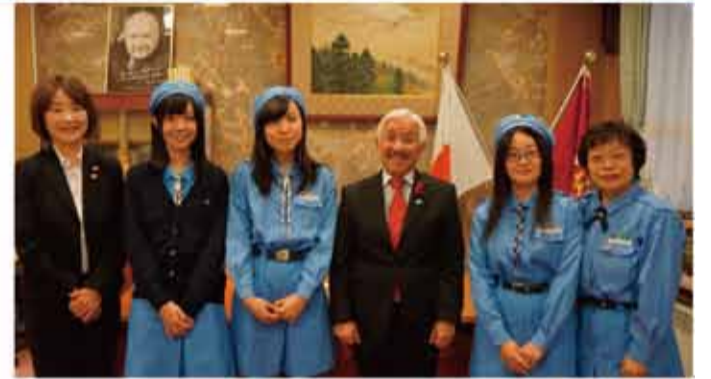
▲ガールスカウトの皆さんが議長室を訪れました。ガールスカウト山梨県連盟が毎年取り組まれている「1日1円募金」で集まった浄財を、今年も「緑の募金」への寄付としてお預かりしました。必ず本県の緑化推進に役立たせていただきます。ありがとうございました。