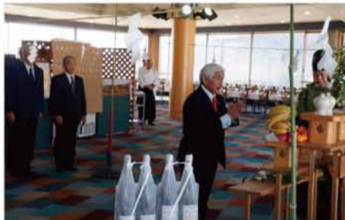
▲サンメドウズ清里スキー場の安全祈願祭に出席して参りました。2013シーズンの安全祈願祭がに地元県議会議員及び北杜市観光協会の会長として出席いたしました。