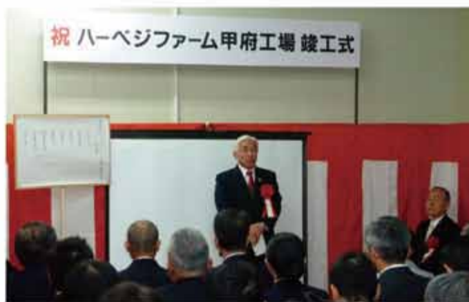
▲「ハーベジファーム甲府工場竣工式」へ出席して参りました。私も精力的に取り組んでいる耕作放棄地対策として、須玉町笹場で生産された農作物を加工する甲府工場の竣工式に出席いたしました。