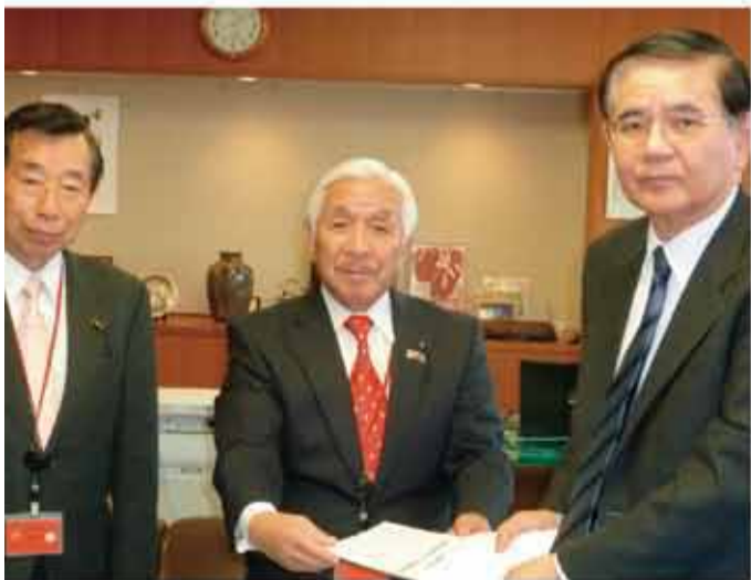
▲笹子トンネル天井板崩落事故に関する要請活動を行いました。国土交通省及び中日本高速道路株式会社八王子支社を訪問し、迅速かつ確実な対応を強く求める要請活動を石井副議長とともに行いました。