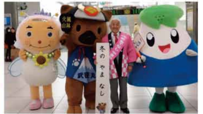
▲「静岡駅で「緊急観光キャンペーン」を実施しました。笹子トンネル天井板崩落事故による観光客の減少を受け、静岡駅構内で実施した緊急観光キャンペーンに北杜市観光協会として参加しました。