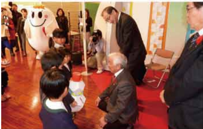
▲「NHK歳末たすけあい」オープニングセレモニーへ出席して参りました。オープニングセレモニーが開催され、山梨県共同募金会の会長として出席いたしました。