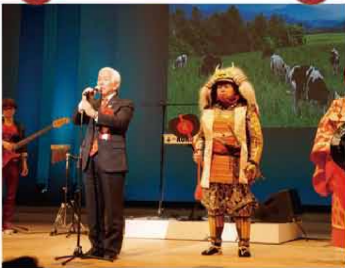
▲国民文化祭の引継式に出席して参りました。昨年の開催県徳島県の閉幕イベントへ横内正明知事とともに出席し、国民文化祭旗の引き継ぎを行うとともに、山梨県の魅力を会場へお集まりの皆様へお伝えして参りました。