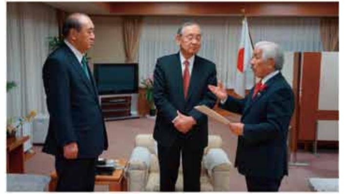
▲鳥獣被害対策に関する知事への提言依然として深刻な鳥獣被害について、県議会初となる鳥獣被害対策のための政策提言をとりまとめ、12月定例会において可決し、直ちに、知事に対し、政策提言を行いました。