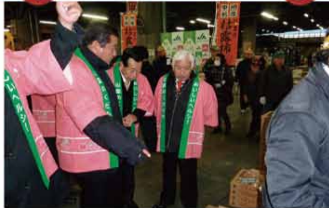
▲「甘露柿・あんぼ柿」のトップセールスを実施しました。市場関係者の皆様に横内知事とともにトップセールスを行い、意見交換会も実施しました。