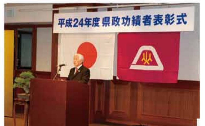
▲「平成24年度県政功績者表彰式」に出席して参りました。県政の各分野において、県民福祉の増進に特にご功績をあげられました方を顕彰する県政功績者表彰の受賞者にお祝いの言葉を申し上げて参りました。