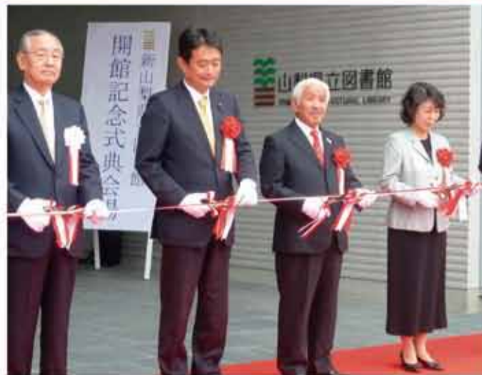
▲「新山梨県立図書館」開館記念式典に出席して参りました。県のビッグプロジェクトでありました、新県立図書館が開館いたしました。末永く県民に親しまれ成長・発展していく県立図書館であることを切に願います。