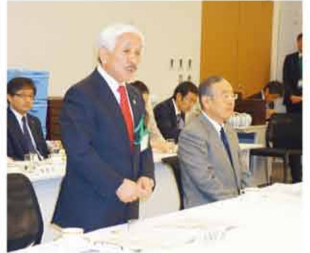
▲県選出国會議員に対し、本県の様々な課題への力添えを要望