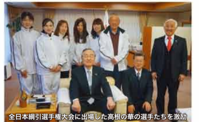
全日本綱引選手権大会に出場した高根の華の選手たちを激励