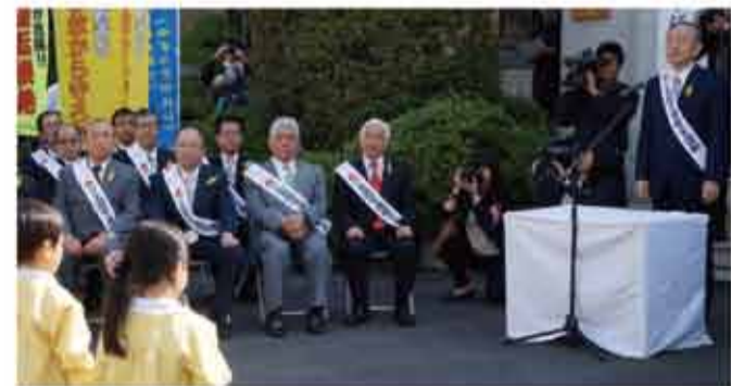
▲「春の全国交通安全運動出発式」に出席しました。「子どもと高齢者の交通事故防止」を全国の基本運動方針に実施されます、春の全国交通安全運動出発式に出席して参りました。