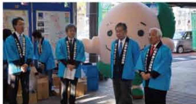
▲「街頭緑化キャンペーン」を宮島市長と一緒に実施しました。公益財団法人山梨県緑化推進機構と山梨県が共催し、甲府駅において緑化活動の普及啓発及び緑の募金活動への理解と協力を呼びかけました。