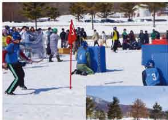
▲▲第7回山梨県雪台戦大会を開催。県内外から34チームが参加し、冬晴れの八ヶ岳の麓において、熱い大会が繰り広げられました。雪台戦が冬季五輪の正式種目となる日を夢見て、今後とも精力的に取り組んで参ります。