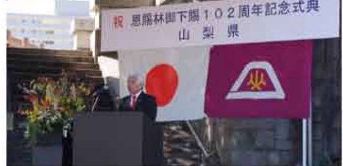
▲恩賜林御下賜102周年記念式典に出席。恩賜林百余年の歩みに感謝の念を深めながら、御下賜以来、大切に守り育てられてこられた先人の御苦労に対しまして深甚なる敬意と感謝の意を表し、ご挨拶して参りました。