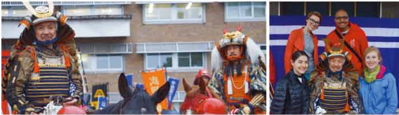
▲「第42回信玄公祭り甲州軍団出陣」 「富士の国やまなし国文祭」の春のオープニングイベントであります甲州軍団出陣へ、昨年に引き続き38名の県議会議員が全員参加しメインイベントの盛り上げに一役買いました。

力強い山梨県、力強い北杜市を実現するために、多くの皆様の御支援、御協力を賜りますようお願い申し上げます。