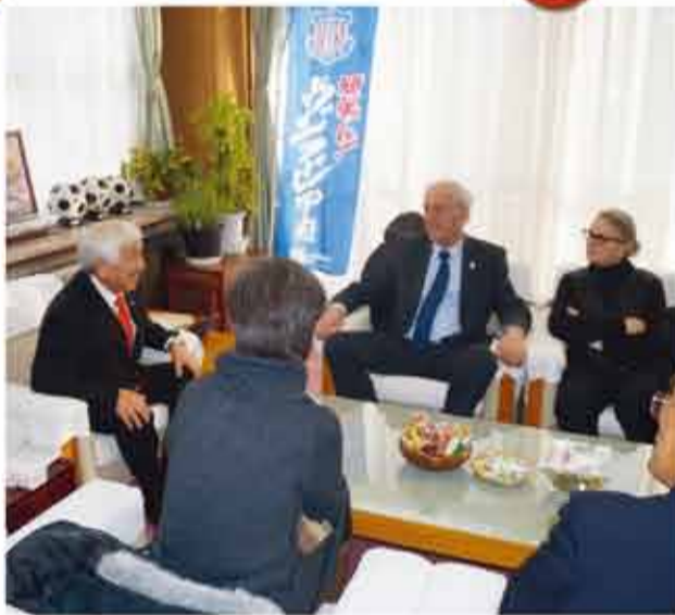
▲親日家で知られるフランス国民議会のヴォワザン元議員と面談