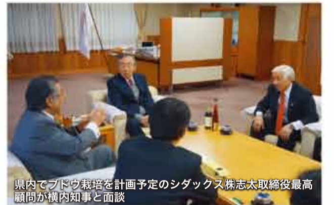
県内でブドウ栽培を計画予定のシダックス株志太取締役最高顧問が横内知事と面談