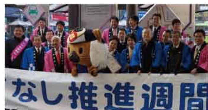
▲2月1日からの「おもてなし推進週間」で街頭キャンペーン。 県民の皆様へ理解と関心を深めていただくため、甲府駅において街頭啓発キャンペーンを行いました。