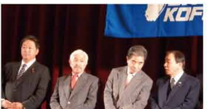
▲VF甲府のキックオフパーティでJ1での熱い戦いを激励。 2013シーズン、チーム一丸となって県民の期待に応える結果が出るよう心から期待しております。