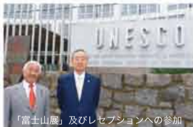
「富士山展」及びレセプションへの参加