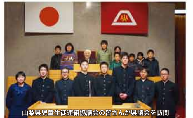
山梨県児童生徒連絡協議会の皆さんが県議会を訪問