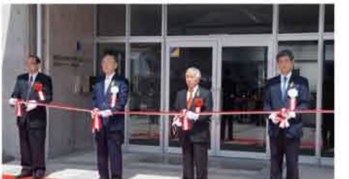
▲「山梨県立産業技術短期大学校都留キャンパス開校式、山梨県立就業支援センター都留分室開所式」に出席しました。