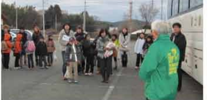
▲「菜の花プロジェクト」で風船おっかけツアー。 花の種とメッセージカードを添えた風船が約150km離れた茨城県内の圏央道建設現場へ届いたことがきっかけで、高根西小学校の親子24組が現場に訪れました。