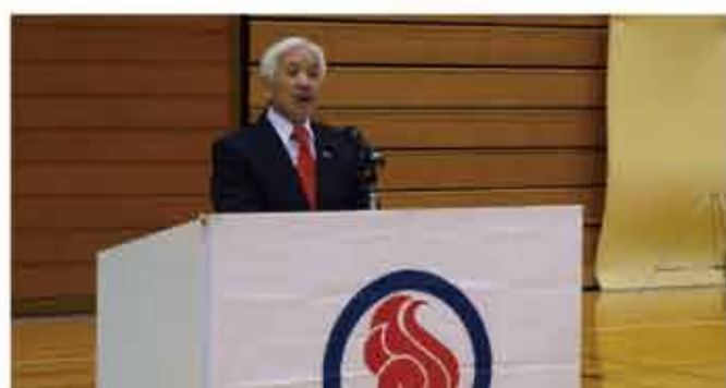
▲国体冬季大会結団壮行式でスキー競技に出場する山梨県選手を激励。 県議会を代表し出席し、選手・役員の皆様へ激励の言葉をお伝えして参りました。