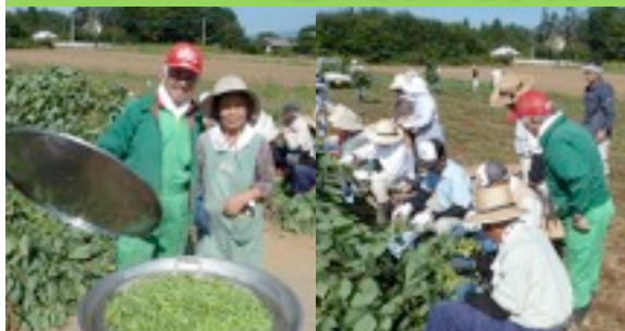
▲9月20日 枝豆摘み取りが行われました。 天候不順のため菜の花がだめになりその代わりに枝豆をまいた畑での作業となりました。総勢30名が参加し、枝豆がとても素晴らしい成果物となりました。収穫した枝豆は、高根西小学校の生徒さんへ届けられました。