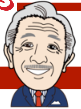
県議会議員 浅川 力三