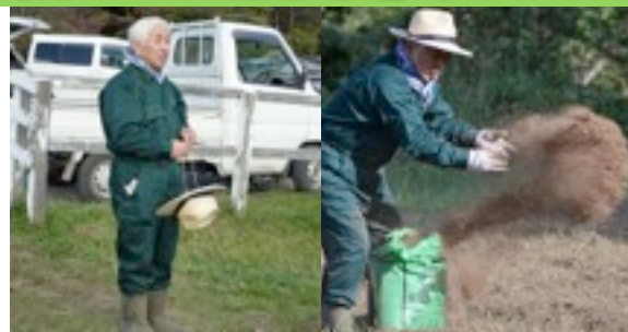
▲10月2日 今年はじめての種蒔きを行いました。 昨年は天候の影響で咲きませんでした、今年はしっかり咲かせたいと思っています。多くの参加者とともに気持ちを込めて種蒔きをしました。 圃場/キープ協会：1町歩 風の丘：4反