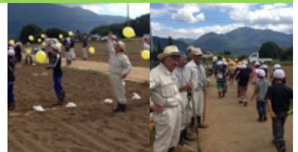
▲10月11日 種蒔きと風船飛ばしを行いました。 午前8：00から11：00まで高根町の小池地区で高根町小池地区老人の会、高根西小学校全校児童と一緒に総勢250名の方々と一緒に気持ちの良い汗をかきました。圃場/高根町小池地区：4反