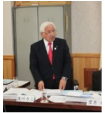
▲決算特別委員会で中小企業支援策などについて私の持論を展開しました。