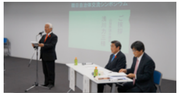
▲韓国自治体交流シンポジウムへ出席しました。 日時：平成25年12月9日（月） 場所：山梨県庁防災新館2階会議室