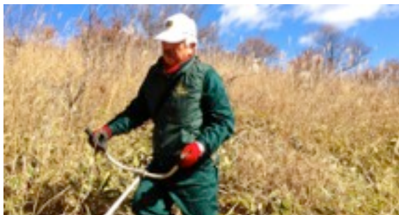
▲ハケ岳のシンボル「美し森」の美化活動を行いました。 日時：11月12日（火）、観光協会高根支部および大泉支部主催にて清里観光振興会、高根文化協会など多くの団体の皆様にご協力いただきました。