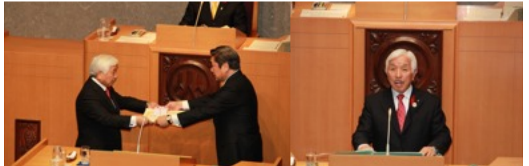
▲全国都道府県議会議長会長から功勞議員として表彰をいただきました。本会議場で謝辞を申し上げました。議員活動を支援していただいた多くの方々に感謝いたします。」