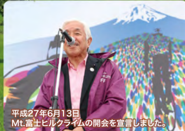
平成27年6月13日 Mt.富士ヒルクライムの開会を宣言しました。