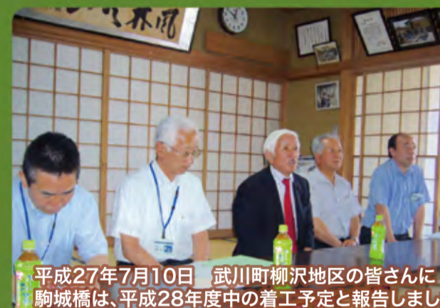
平成27年7月10日 武川町柳沢地区の皆さんに 駒城橋は、平成28年度中の着工予定と報告しました。