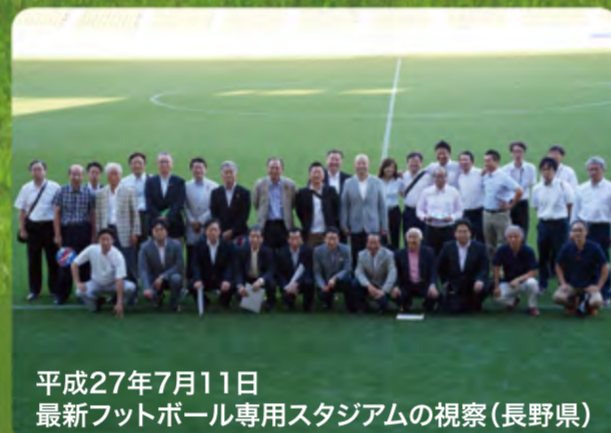
平成27年7月11日 最新フットボール専用スタジアムの視察(長野県)