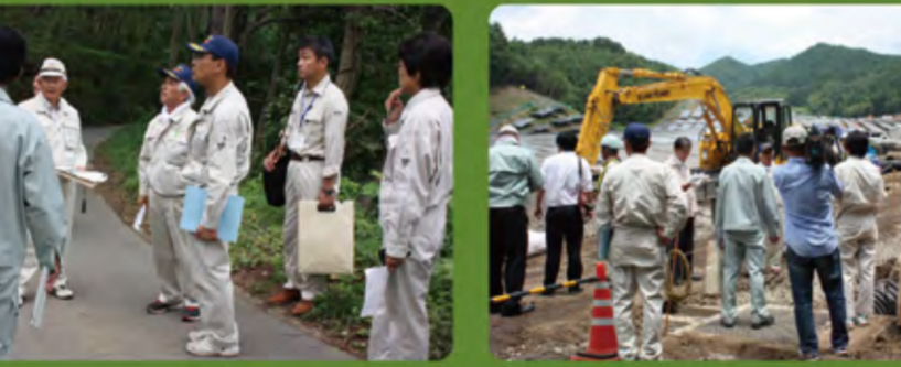
・北杜市高根町下黒澤