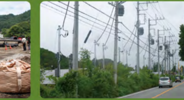
・クリーンエネルギー清里の杜太陽光発電所