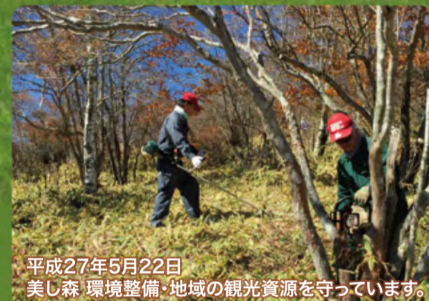
平成27年5月22日 美し森 環境整備・地域の観光資源を守っています。