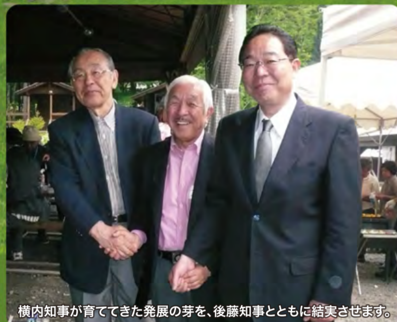
横内知事が育ててきた発展の芽を、後藤知事とともに結実させます。