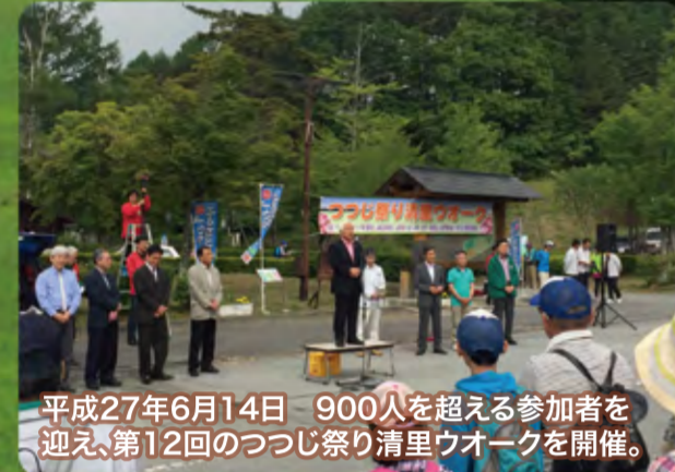
平成27年6月14日 900人を超える参加者を迎え、第12回のつつじ祭り清里ウォークを開催。